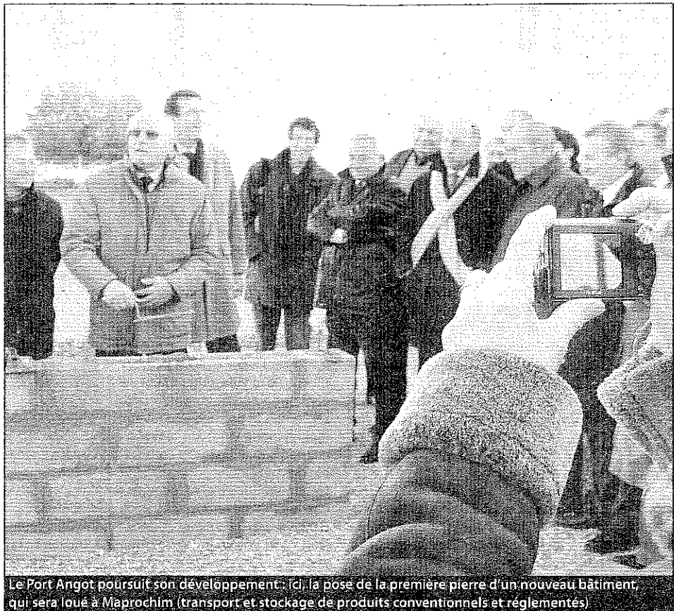
Le Port Angot poursuit son développement : (ci) la pose de la première pierre d'un nouveau bâtiment, qui sera loué à Mapprochim (transport et stockage de produits conventionnels et réglementés)

Malicieusement, le député a souligné qu'en cas de fermeture, les collectivités ne financeraient plus